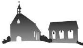
St. Georgskirche Sengwarden