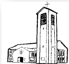
Kirche St. Martin